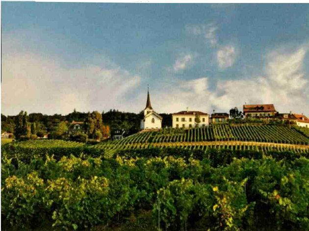
Die Domaine La Colombe liegt im waadtländischen Féchy. Das Genferseegebiet gilt als Ursprungsort der Chasselas-Traube.